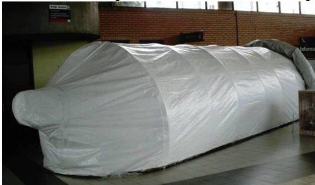
Trensurb São Leopoldo RS.

Com imagens de DSTs/AIDS que se espalham por todo o corpo com reflexo para a posteridade. São 12 banners em cada corredor que chamam à reflexão sobre o processo da vida e alertam sobre os riscos das DSTs/AIDS.